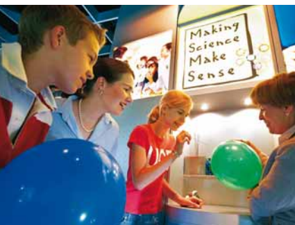
Gesellschaftliches Engagement 82